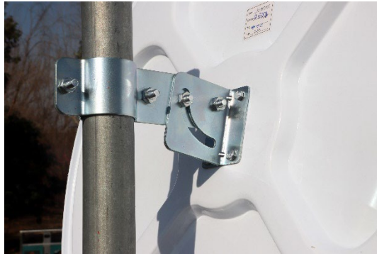
Fäste för stolpe 60 mm