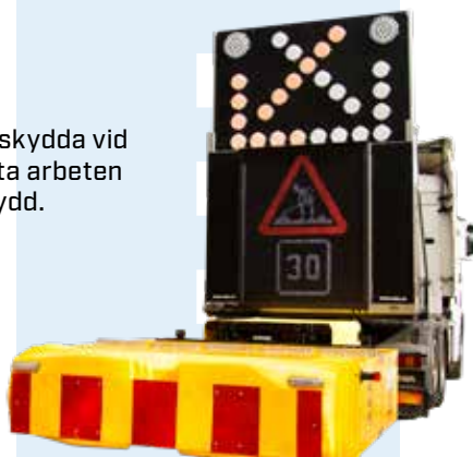
TMA-skydd Alpha 60 MD 2.0