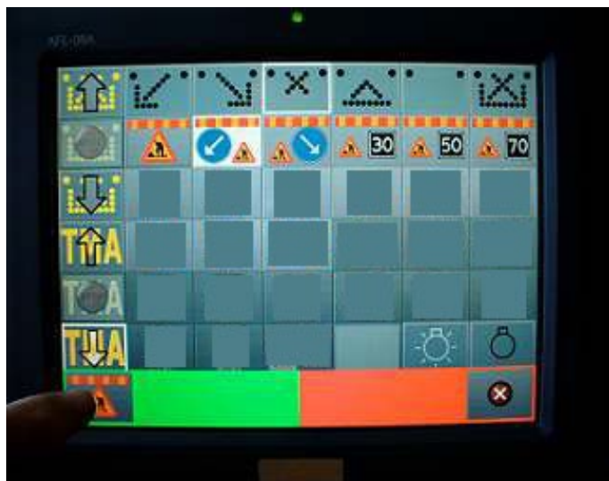
Bekräfta valt budskap